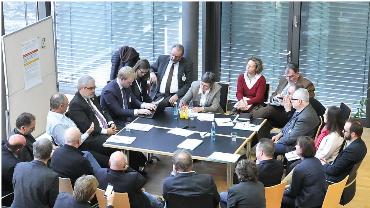
Gruppenarbeit auf der Auftaktveranstaltung mit Kommunen im Januar 2017.

Alle Kommunen rund um den Flughafen werden in die Untersuchungen auf Kreis- oder Gemeindeebene einbezogen. Für diejenigen Kommunen, die sich aktiv an der Datenbeschaffung beteiligen, führt das wissenschaftliche Team vertiefende Analysen durch und bereitet Dossiers mit Daten und Indikatoren auf.